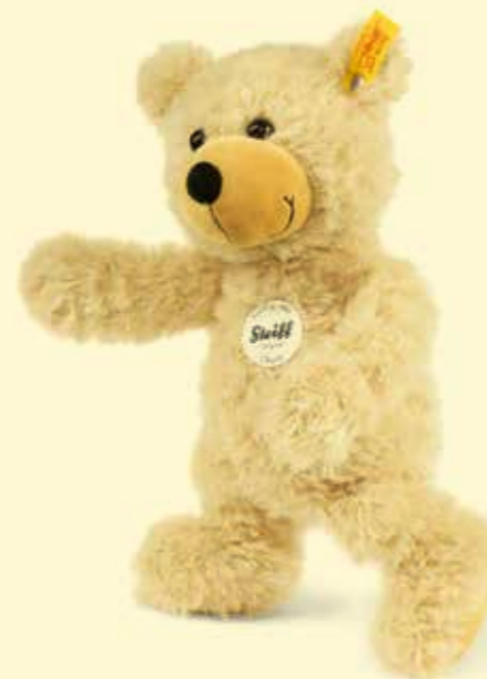
Seit 1880 gibt es das von Margarete Steiff gegründete Unternehmen in Baden-Württemberg.