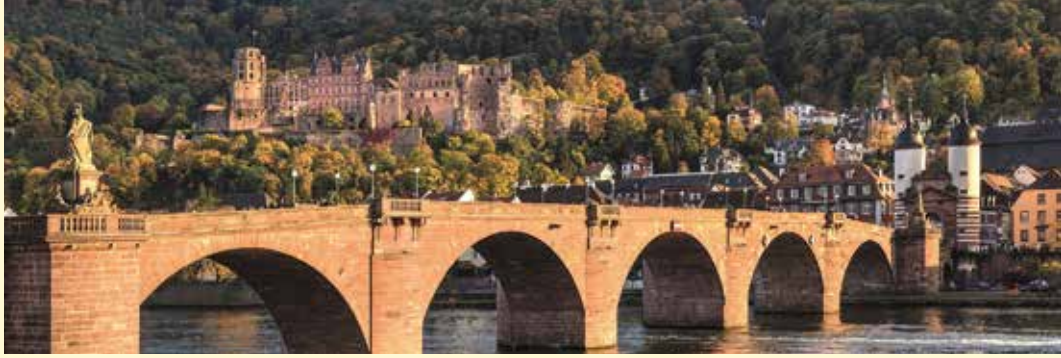
Heidelberg mit seiner malerischen Altstadt ist weltweit nicht nur für sein Schloss, sondern auch für die älteste Universität Deutschlands (gegründet 1386) bekannt.