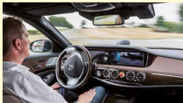
Als erster Autohersteller der Welt hat Mercedes-Benz mit dem Forschungsfahrzeug S 500 INTELLIGENT DRIVE schon im August 2013 auf historischer Strecke gezeigt, dass auch im Überland- und Stadtverkehr autonomes Fahren möglich ist.

Eine erfolgreiche Industrieregion wie Baden-Württemberg gibt wesentliche Anstöße für unternehmensnahe Dienstleistungen. Mit hochwertigen und technologieorientierten Angeboten ist diese Branche ein dynamischer Partner für die Industrie und bedeutender Faktor bei der Steigerung von Produktivität und Wettbewerbsfähigkeit.