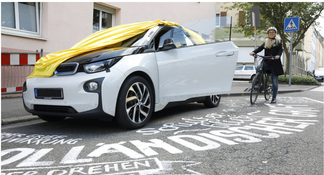
Dooring- Unfälle.

Die Bilder können Sie in der VM Mediathek herunterladen.