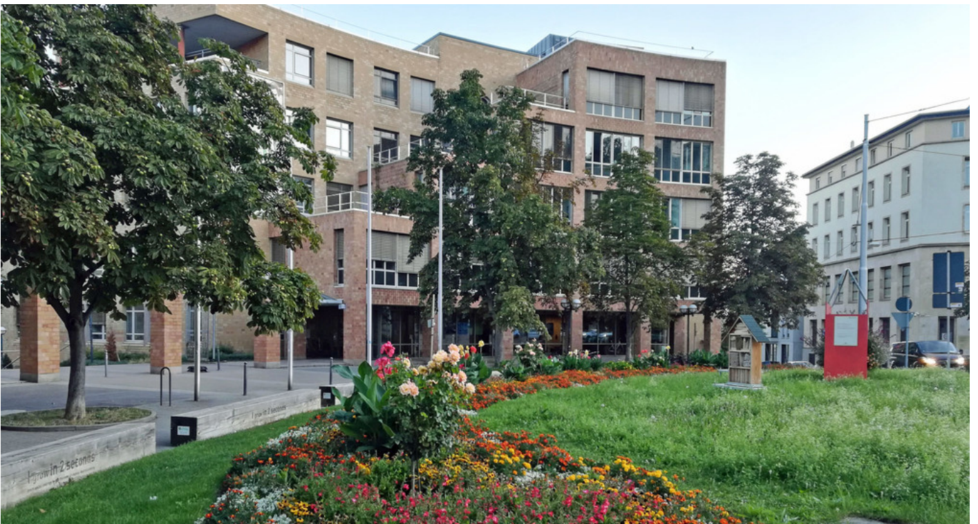
Ministerium für Umwelt, Klima und Energiewirtschaft Baden-Württemberg

Bildunterschrift aus den Metadaten des Bildes