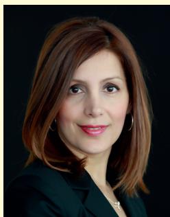
Bilkey Öney Ministerin für Integration Baden-Württemberg